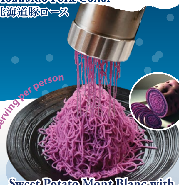
Sweet Potato Mont Blanc with Vanilla Ice Cream