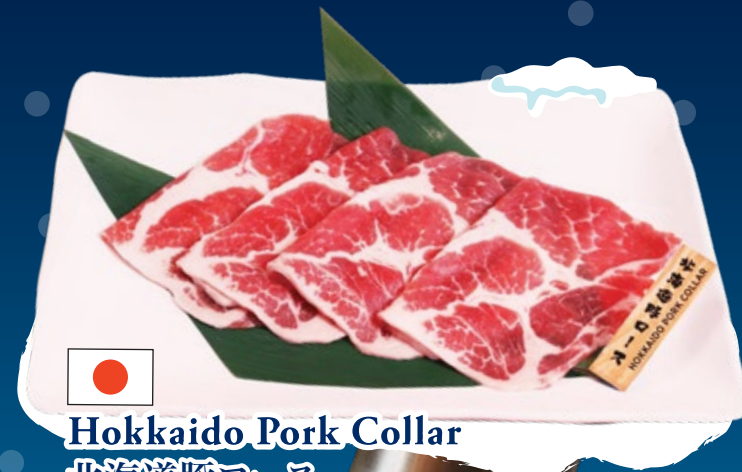
Hokkaido Pork Collar 北海道豚ロース