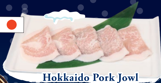
Hokkaido Pork Jowl 北海道豚トロ