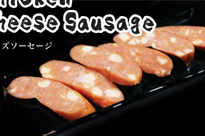
チーズソーセージ