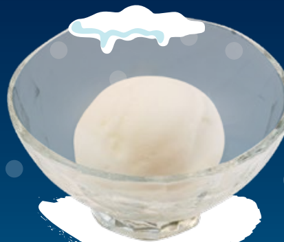
Hokkaido Otaru White Grape Sorbet 小樽ぶどうシャーベット