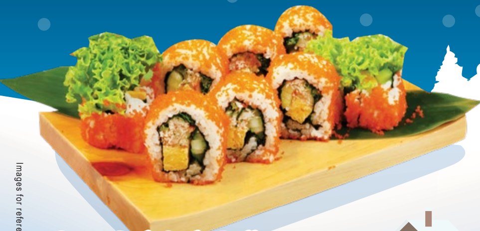
Snow Crab Sushi Roll ズワイガニ寿司ロール