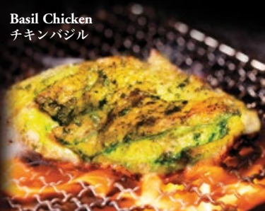
Basil Chicken チキンバジル