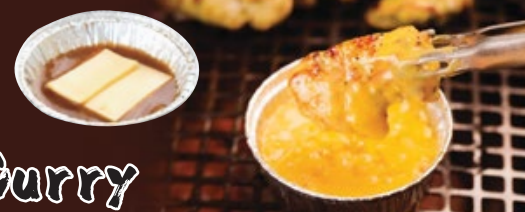
チキンチーズカレー