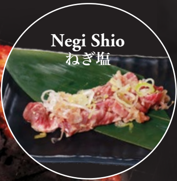
Negi Shio ねぎ塩