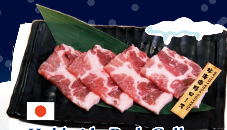
Hokkaido Pork Collar