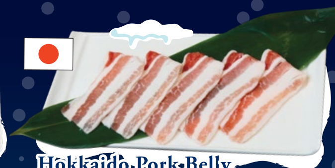
Hokkaido Pork Belly 北海道豚バラ