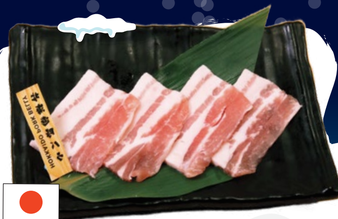
Hokkaido Pork Belly