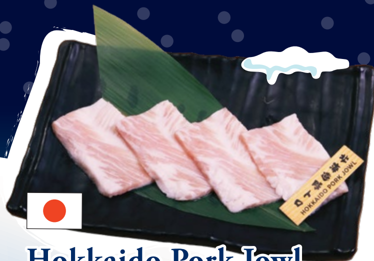
Hokkaido Pork Jowl