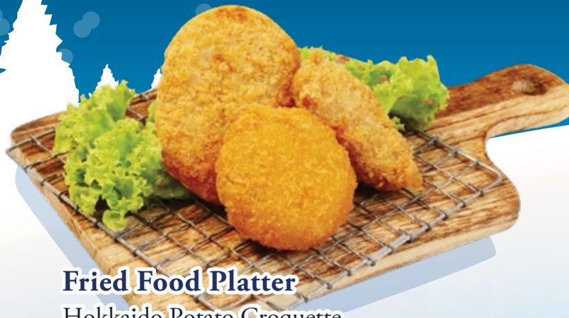
Fried Food Platter

Hokkaido Potato Croquette, Crab Creame Croquette, Fried Oyster コロッケと牡蠣フライの盛合せ